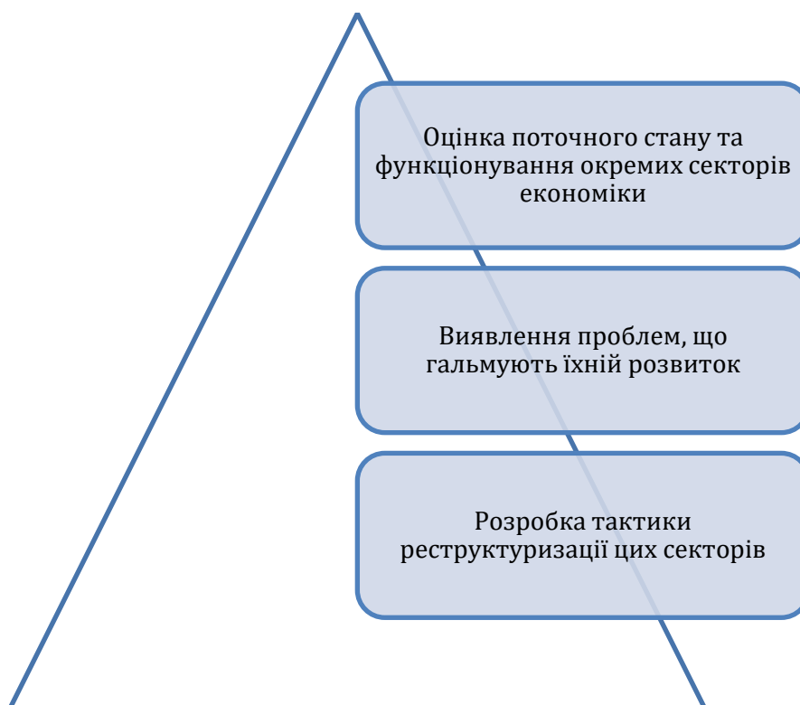
Рис. 2. Етапи процесу відновлення економіки в Україні після війни

Процес відновлення економіки має бути комплексним та добре зорієнтованим. Це включає в себе наступні етапи (рис. 2):