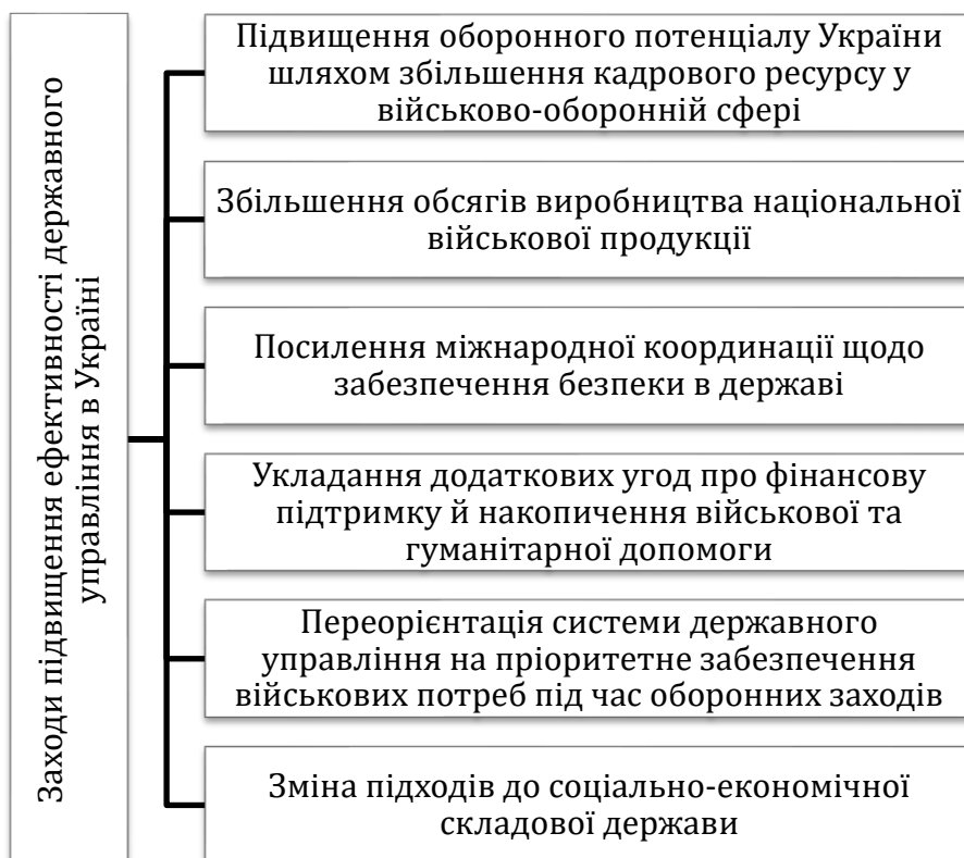
Рис. 1. Основні заходи для підвищення ефективності державного управління в Україні в умовах воєнного стану

На сьогодні для підвищення загальної ефективності механізму державного управління в Україні було впроваджено низку заходів (рис. 1).