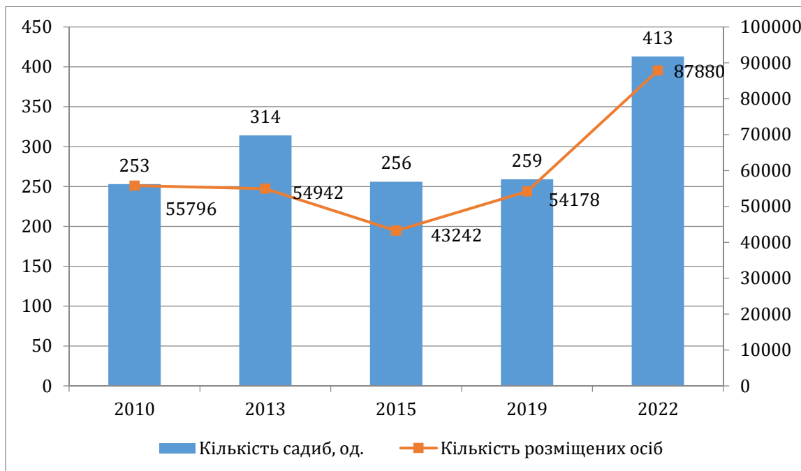
Рисунок 3. Показники розвитку екологічного туризму України за 2010–2022 рр.

Аналіз виділеної групи показує, що максимальна кількість туристів на один район припадає на господарства 2-ї групи (середній рівень розвитку) – 2722 особи, у 1-й групі ця кількість на 183 особи більше кожного туристичного напрямку. Розглянемо важливі показники розвитку екотуризму в Україні, використовуючи дані на рисунку 2. 3.