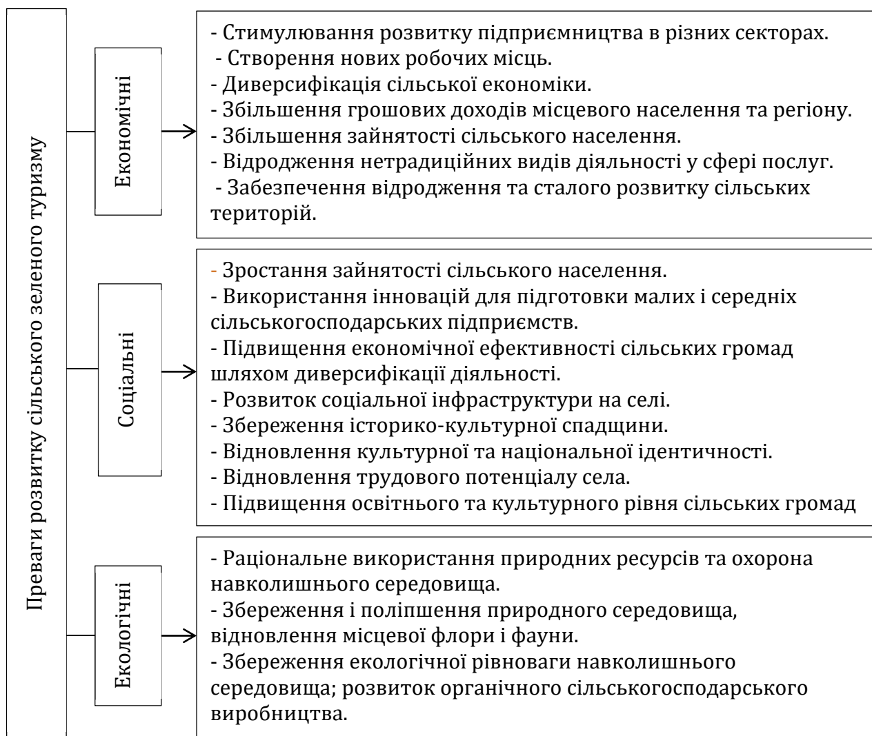
Рисунок 1. Переваги розвитку екотуризму в Україні