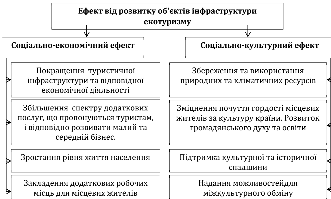
Рисунок 4. Соціально-економічний і соціокультурний ефект від розвитку об'єктів інфраструктури екотуризму

Основні позитивні та негативні аспекти соціально-економічного впливу екотуризму на регіональний розвиток представлені в табл. 4.