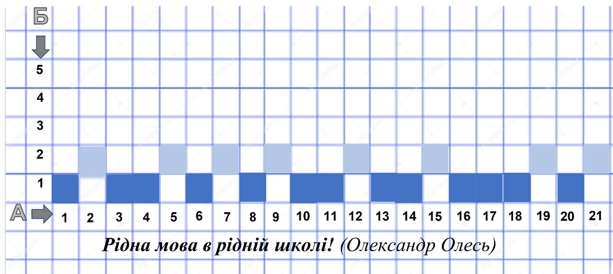
Рис. 1. Графічна схема уривку поетичного твору

Графічна схема одного з уривків представлена на рис. 1.