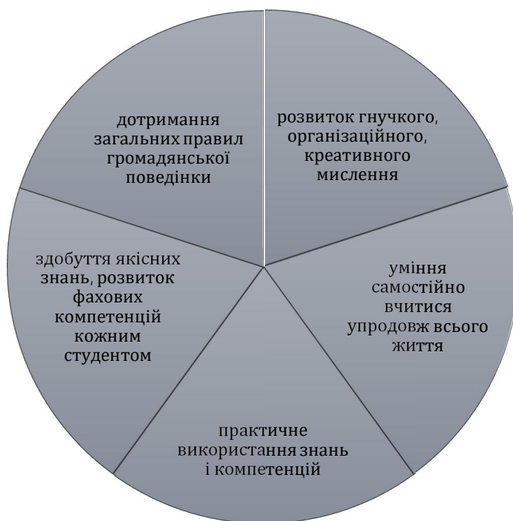
Рис. 1. Цілі студентоцентричної моделі освіти

Студентськоорієнтоване навчання є трансформаційним процесом, який покращує освітнє середовище для студентів, спрямований на розвиток їхньої незалежності та навичок критичного мислення за допомогою продуктивної методології, яка включає в себе інноваційні стратегії розробки навчальних програм, викладання та загального навчання [1, с. 156]. Суть студентоцентризму виявляється у такій моделі розвитку освіти, де здобувач вищої освіти є активним учасником науково-освітнього та культурно-мистецького процесу, тобто перетворюється з об'єкта на суб'єкт навчальної діяльності [2].