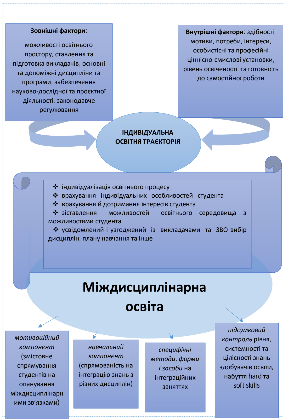
Рис. 3 Студентоцентроване навчання у контексті міждисциплінарної освіти