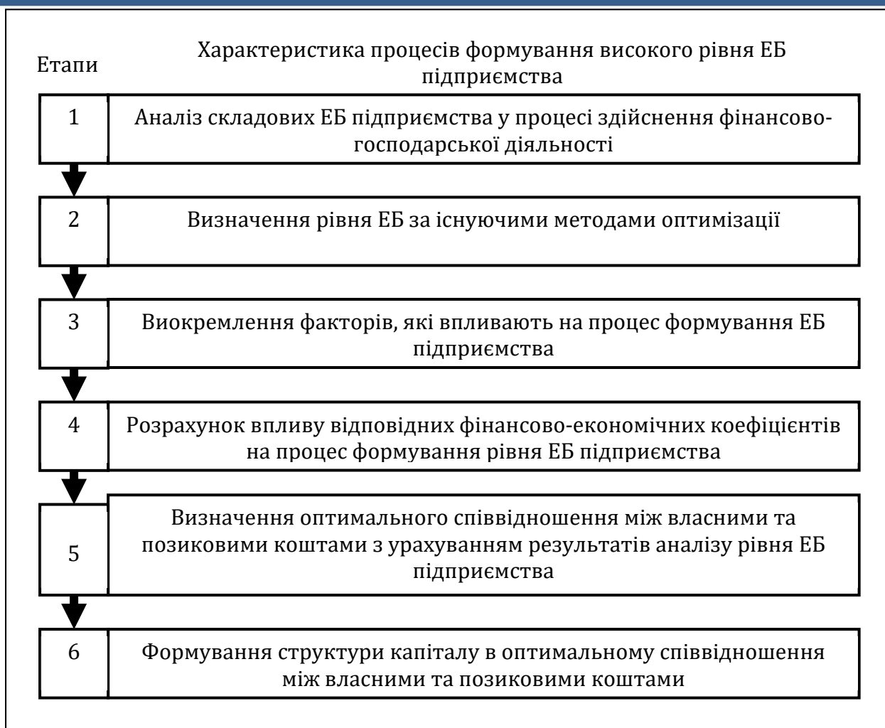
Рис. 2. Етапи процесу формування рівня економічної безпеки підприємства з метою додержання економічної безпеки (розроблено авторами)

Етапи формування рівня економічної безпеки підприємства включають комплексну діагностику всіх складових, що спрямовані на забезпечення захисту від зовнішніх та внутрішніх загроз, а також створення стратегії, яка забезпечить стійкість і конкурентоспроможність підприємства в умовах змінного економічного середовища. Діагностика економічної безпеки повинна проводитися системно, охоплюючи такі функціональні складові, як фінансова, кадрова, техніко-технологічна, інформаційна, екологічна, ринкова, політико-правова та інші аспекти, які впливають на загальний рівень безпеки підприємства.