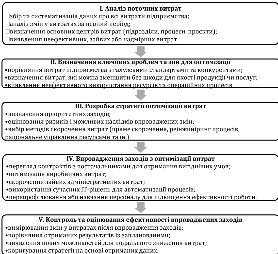
Рис. 1. Процес оптимізації витрат підприємства