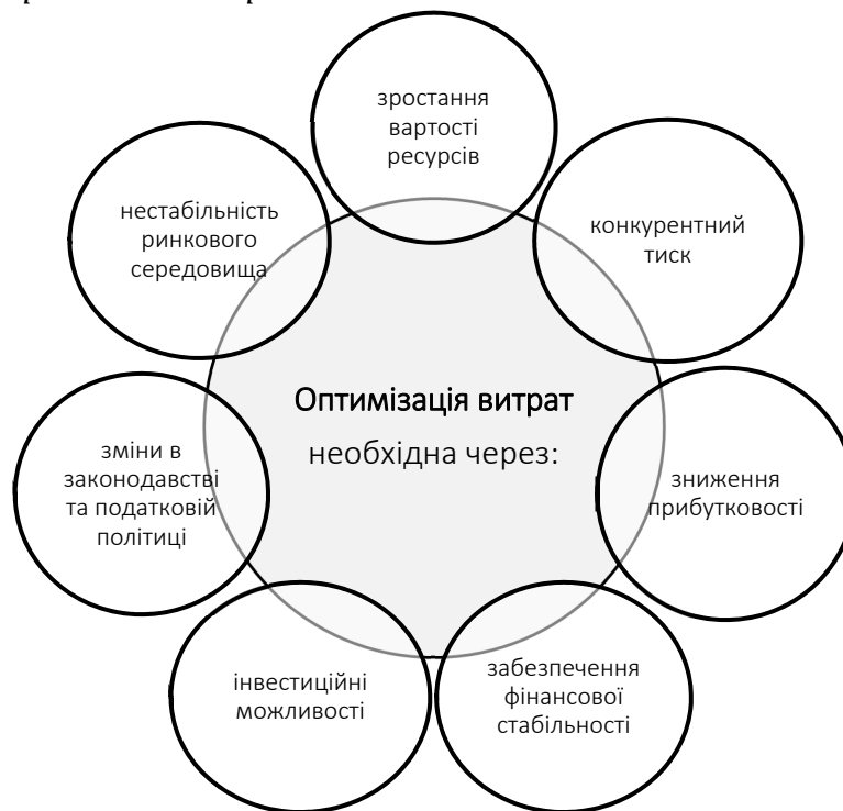
Рис. 2. Фактори необхідності оптимізації витрат підприємства