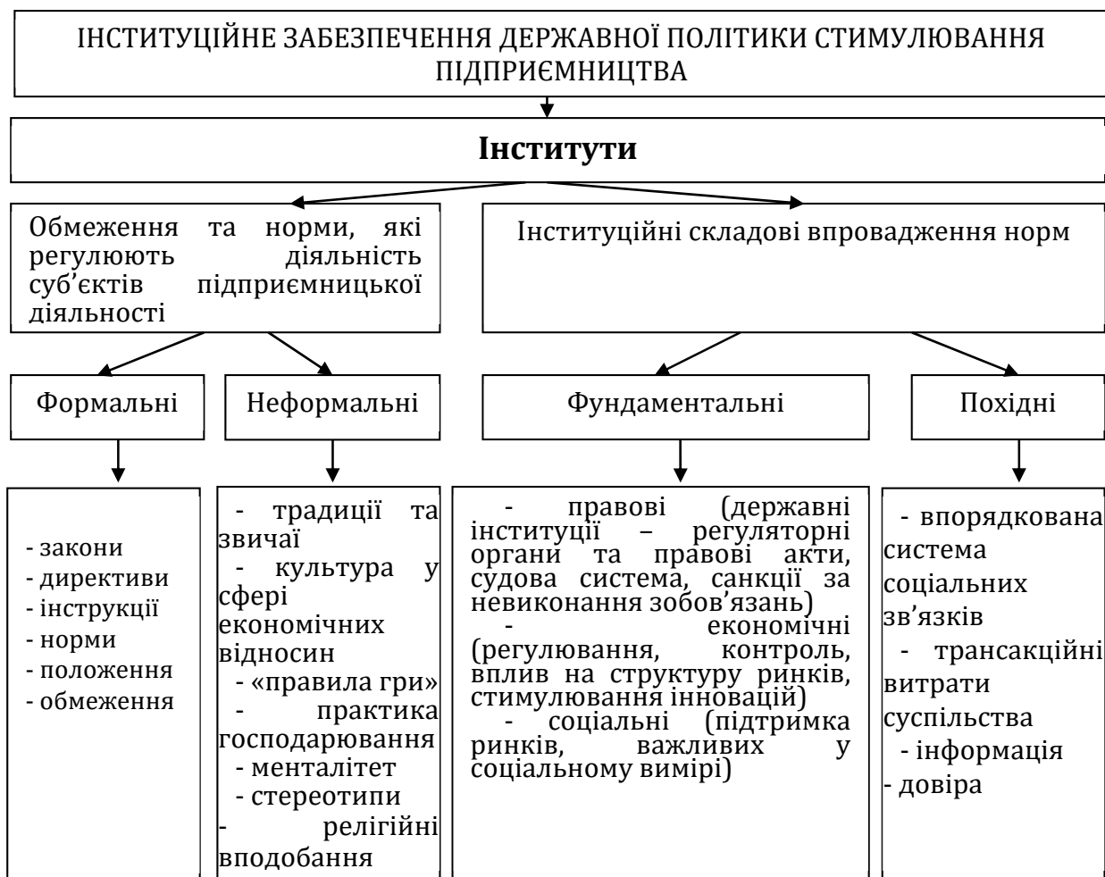
Рис. 1. Інституційні засади державної політики стимулювання підприємництва

Відновлення великих промислових об'єктів має здійснюватися з урахуванням результатів ґрунтового аналізу доцільності реалізації таких проектів. Беручи до уваги, що значна частина промислових підприємств в Україні використовують доволі застаріле обладнання та технології, слід вказати на те, що такий чинник призводить до зниження рівня конкурентоспроможності товарів, що виготовляються такими підприємствами. Саме тому згадані об'єкти потребують значних за обсягами інвестиційних ресурсів для модернізації.