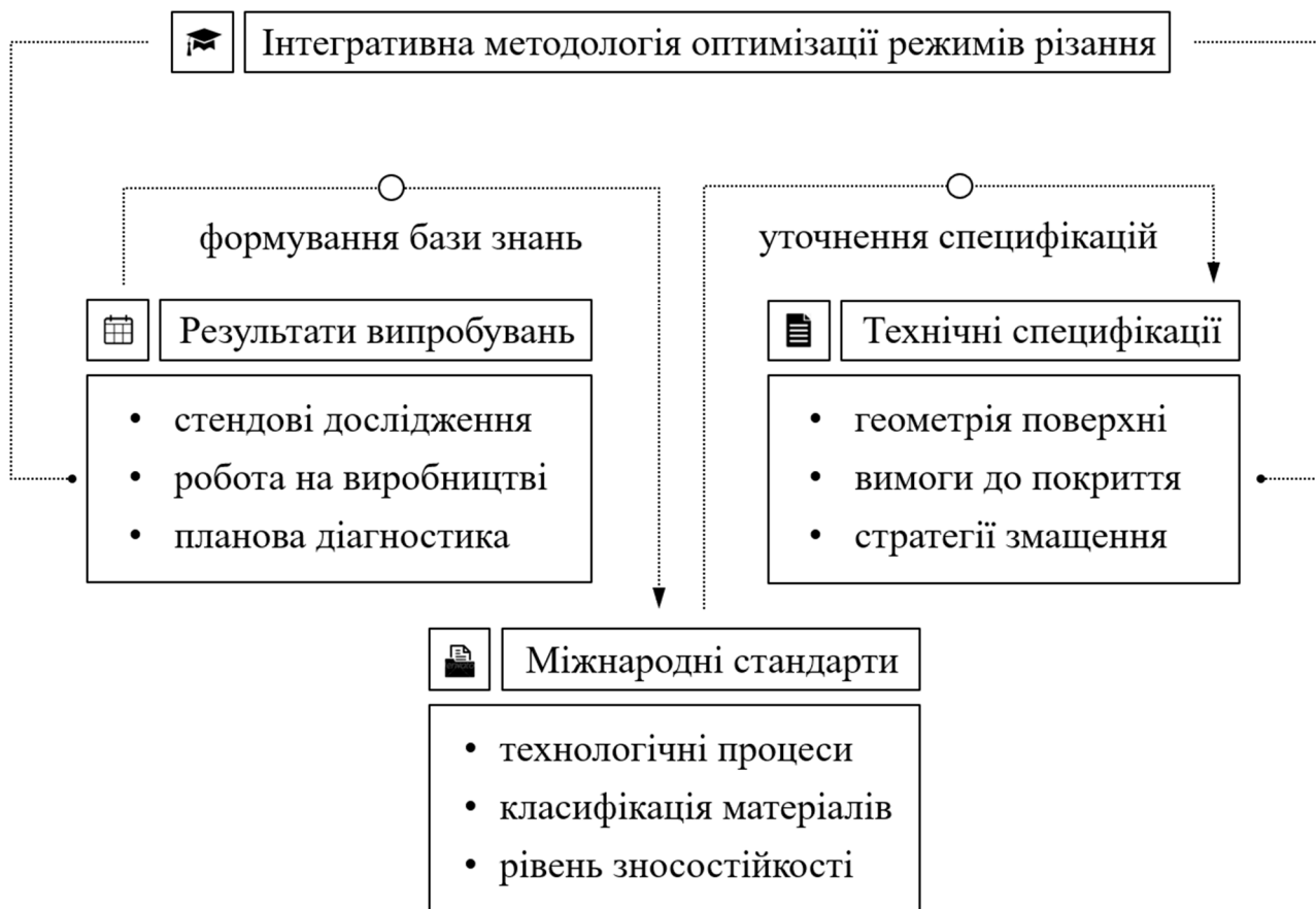
Рис. 2. Формування інтегративної методології оптимізації режимів різання

Таким чином, метою роботи стала побудова цілісної методології є розробка інтегрованої методології оптимізації режимів різання при обробці загартованих сталей з урахуванням властивостей матеріалу, параметрів інструментального оснащення та вимог до якості й ефективності процесу.