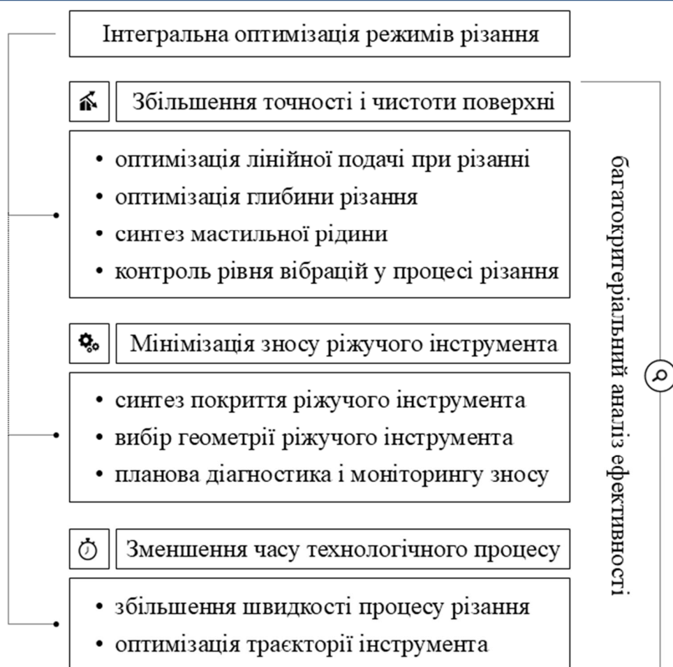
Рис. 3. Структура багатокритеріального підходу до інтегральної оптимізації режимів різання загартованих сталей

Кожен з напрямів надалі деталізується через відповідні технічні заходи, формуючи єдину систему впливу, результати якої можуть бути представлені у вигляді узагальненої функції ефективності.