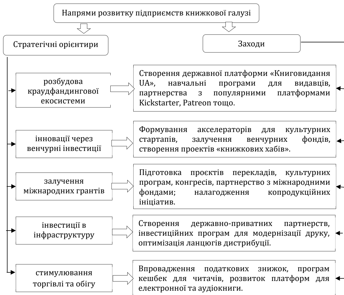
Рис. 2. Стратегічні напрями розвитку підприємств книжкової галузі

На основі системи інструментів виокремлено прогностичні стратегічні орієнтири для розвитку книжкової галузі у короткостроковій та середньо- та довгостроковій перспективі (рис. 2).