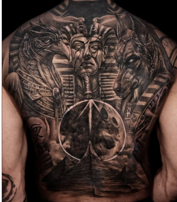
Рис. 3. Симетрична масштабна композиція спини з єгипетською символікою

Водночас повнота професійної зрілості виявляється не лише в камерних портретних рішеннях, а й у здатності працювати з великим форматом та складною структурною організацією зображення. Саме масштабна композиція (рис. 3) дозволяє оцінити рівень просторового мислення, композиційної дисципліни та концептуальної узгодженості художнього задуму.