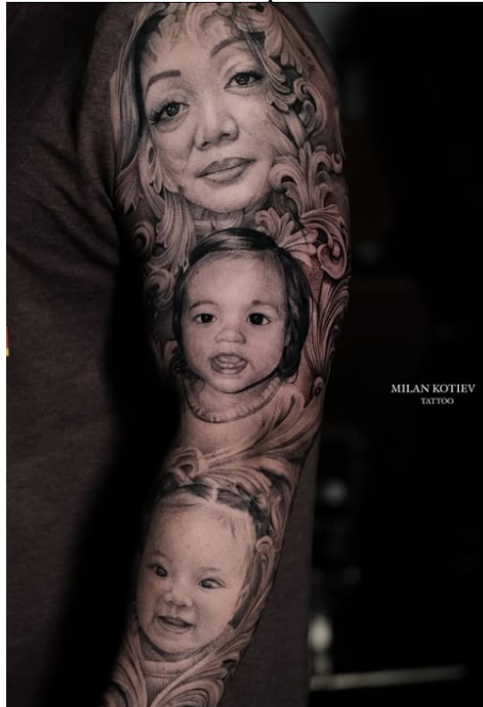
Рис. 2. Реалістична портретна композиція (мати та діти)

Подана структурна послідовність засвідчує, що цифрова впізнаваність не є початковою умовою професійного становлення, а постає результатом поступового накопичення технічного та художнього потенціалу. У цифрову епоху репрезентаційний рівень завершує процес формування майстерності, оскільки зворотний зв'язок аудиторії безпосередньо впливає на подальше вдосконалення технічних і стилістичних рішень. Отже, професійна майстерність сучасного тату-майстра набуває характеру динамічно організованої системи, у межах якої традиційна художня підготовка функціонує у взаємодії з механізмами цифрової культури та публічної комунікації. У цій структурі особливого значення набуває рівень художньої зрілості, який найвиразніше проявляється у портретній практиці. Саме портрет – рис. 2 - є складним випробуванням професійної підготовки, оскільки вимагає одночасного контролю пропорцій, пластики, світлотіньових переходів та психологічної виразності.