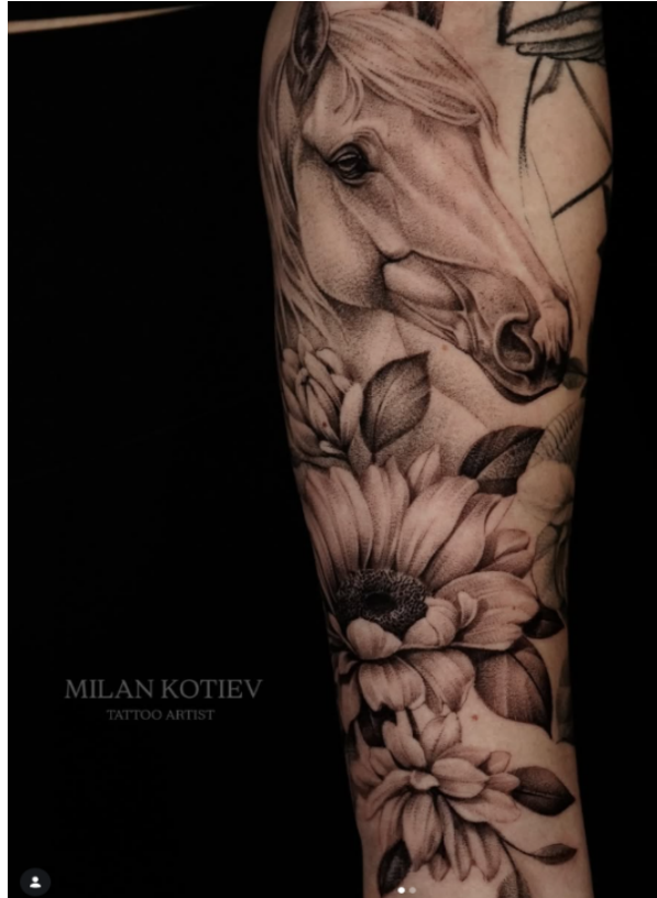
Рис. 4. Композиція з образом коня та флористичними елементами

Проте завершеність художньої компетентності проявляється не лише у складній композиційній організації великих форматів, а й у тональній культурі виконання, що визначає якість пластичного моделювання форми. Саме здатність працювати з нюансами світлотіні забезпечує візуальну глибину та естетичну цілісність татуювання – рис. 4.