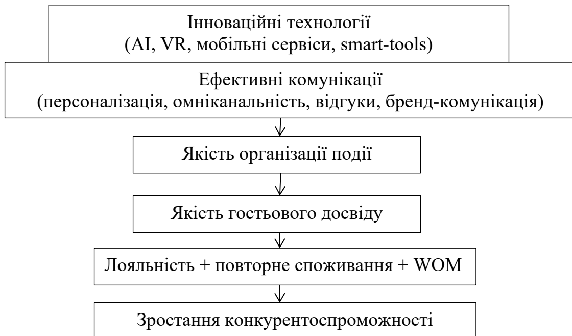
Рисунок 2. Механізм впливу інновацій в івент-менеджменті та комунікативному менеджменті на результати підприємства

З методичної точки зору запропоновану інтеграцію доцільно розглядати через чотири взаємопов'язані блоки: організаційний, технологічний, сервісний і репутаційний. Організаційний блок охоплює координацію персоналу, розподіл ролей і внутрішні комунікації. Технологічний блок включає цифрові сервіси, автоматизацію, аналітику даних і smart-рішення. Сервісний блок формує якість досвіду гостя безпосередньо у процесі контакту з брендом. Репутаційний блок забезпечує постійне відтворення позитивного образу підприємства у цифровому середовищі. Така структура є особливо важливою для сучасних готелів і ресторанів, де подія виконує функцію не лише продажу послуги, а й створення брендової історії.