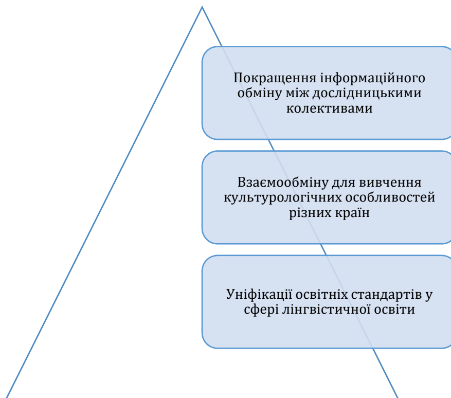
Рис. 2. Аспекти забезпечення якісної підготовки перекладача