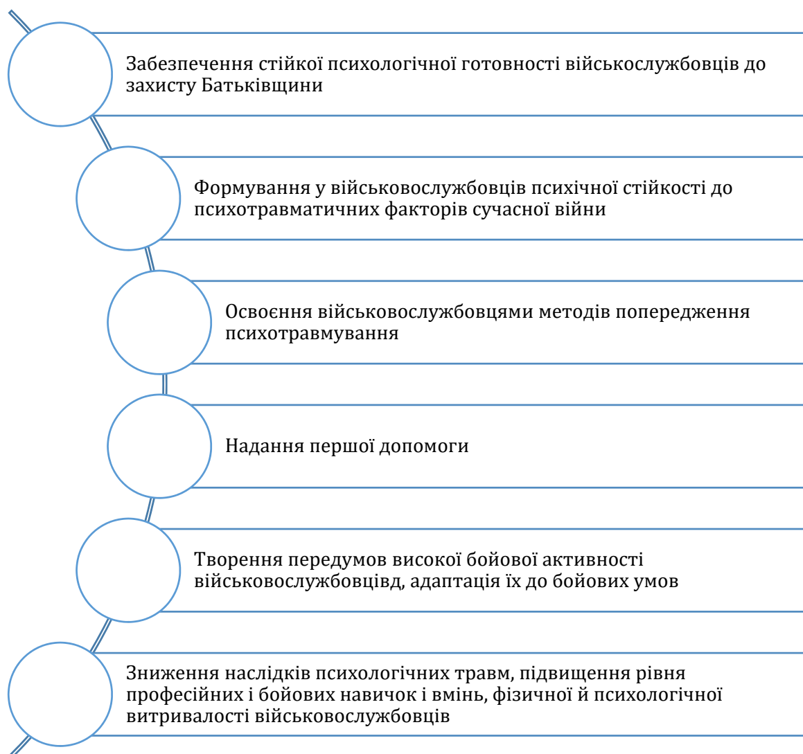
Рис. 3. Головні завдання психологічної підготовки військовослужбовців

Головними завданнями психологічної підготовки являються такі (рис. 3):