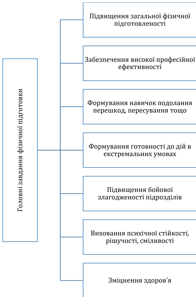
Рис. 2. Головні завдання фізичної підготовки військовослужбовців

Зазвичай фізична підготовка військовослужбовців проводиться в таких формах: