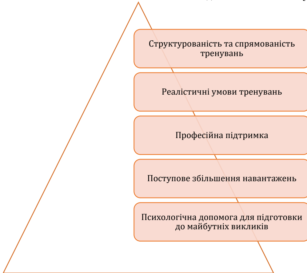
Рис. 3. Чинники, від яких залежить ефективність формування психологічної готовності у військовослужбовців під час фізичних тренувань

військовослужбовців. Постійне оновлення змісту вправ дозволяло застосовувати комплекси, спрямовані на вдосконалення необхідних рухових якостей, що безпосередньо впливають на якість бойової та вогневої підготовки військових [10].