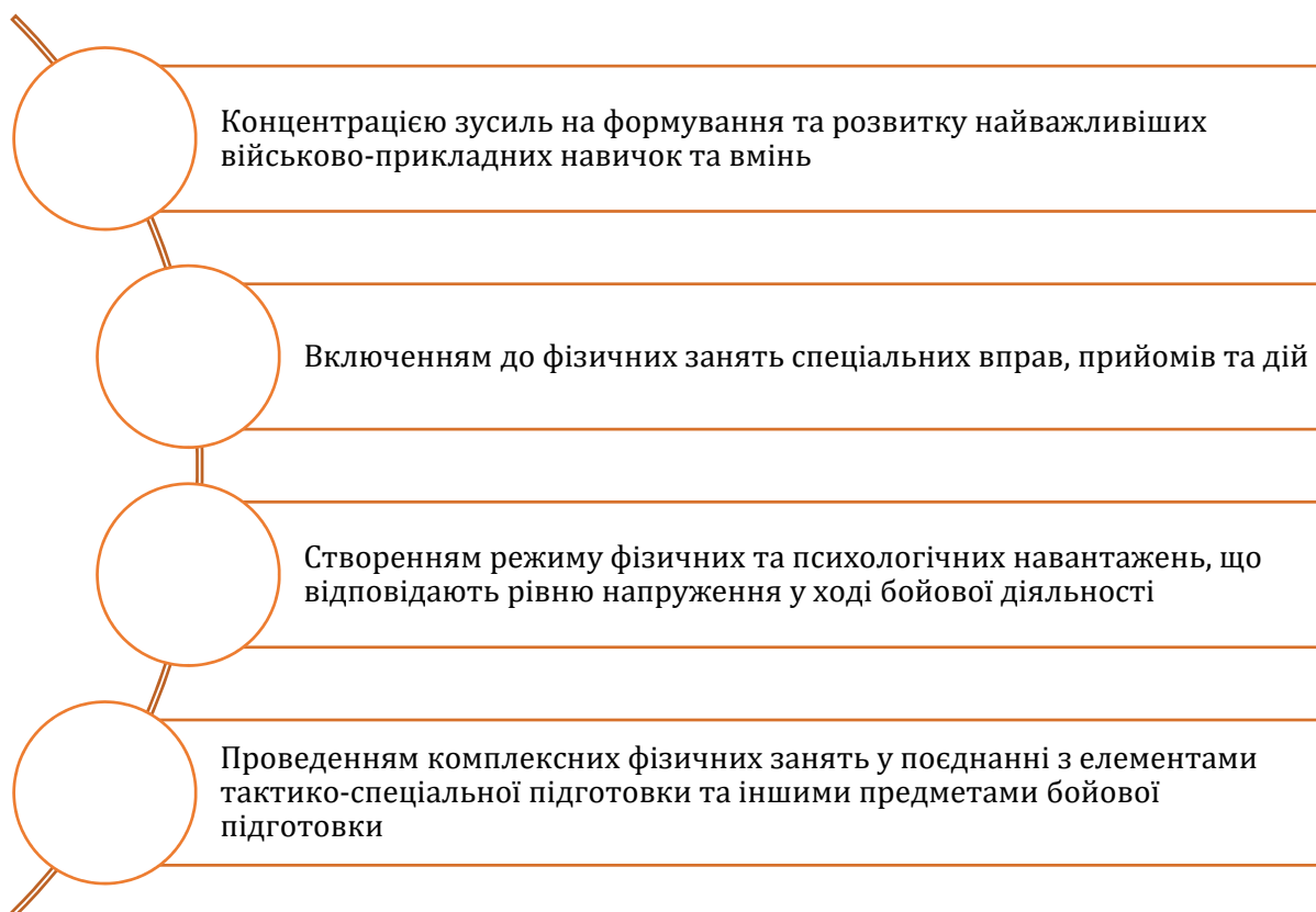
Рис. 1. Аспекти, за допомогою яких досягається військово-прикладна та спеціальна фізична підготовка

Особлива увага у підготовці військовослужбовців приділяється військово-прикладній та спеціальній фізичній підготовці, що досягається наступними аспектами (рис. 1):