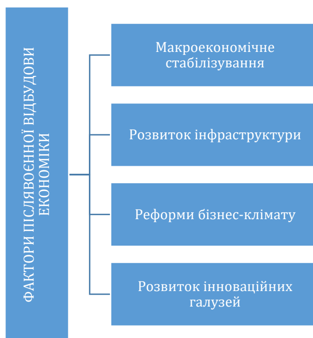
Рис. 2. Головні фактори післявоєнної відбудови економіки України

Після завершення активних бойових дій і припинення режиму воєнного стану акценти повинні бути спрямовані на пріоритетні напрями відновлення. Зокрема, важливим завданням для уряду стане забезпечення макроекономічної стабільності. Крім цього, буде необхідно забезпечити активний розвиток інфраструктури для підтримки економічного зростання. Поліпшення бізнес-клімату через реформи буде сприяти залученню інвестицій та підприємницькій активності. Новітні галузі та інноваційні проекти стають важливим кроком у розвитку, забезпечуючи конкурентоспроможність і перспективи для майбутньої відбудови національної економіки (рис. 2).