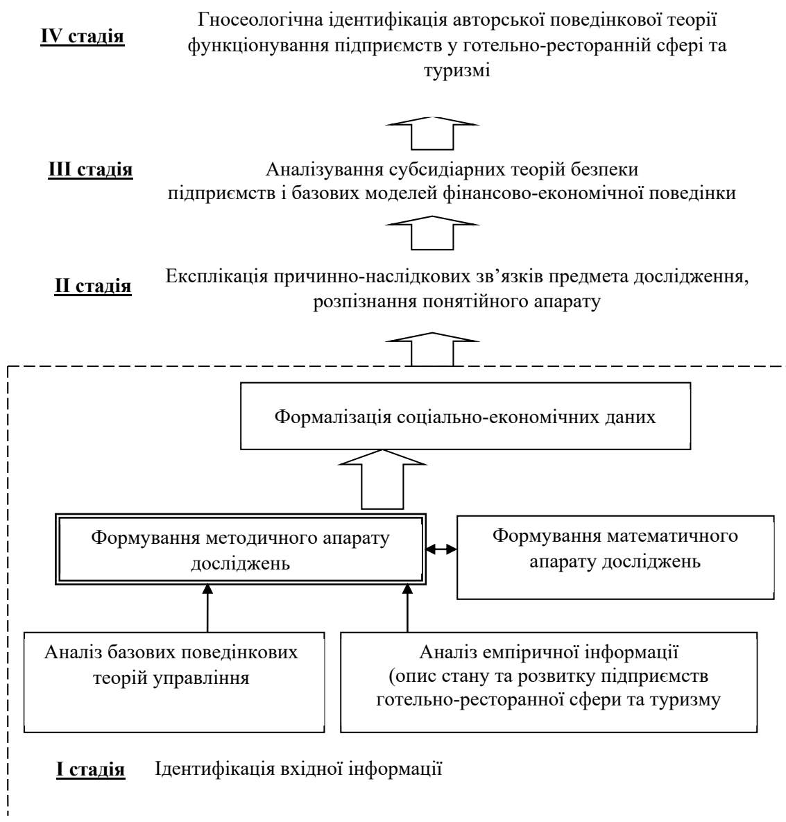
Рис. 2. Методологія авторських досліджень при побудові поведінкової теорії функціонування підприємств готельно-ресторанної сфери та туризму

3) необхідність взаємоузгодження ролі базового та оболонкового теоретичного підґрунтя. Це вимагає, в свою чергу, уточнення авторської позиції на теоретичному рівні дослідження, тому що будь-які завершені наукові дослідження повинні мати інтерпретацію на рівні авторського варіанту уточнення певної теорії як конфігурації наукових знань.