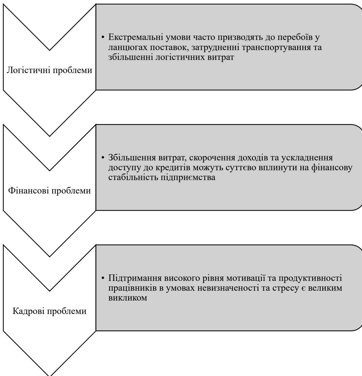
Рис.3. Сучасні проблеми при використанні ресурсів підприємства в екстремальних умовах

Наголосимо, що у разі екстремальних подій, використання ресурсів підприємством набуває особливі риси, які мають на увазі комплексний і багаторівневий підхід до самої системи управління як такої. Його можна охарактеризувати як глибока інтеграційна система раннього реагування на зміни зовнішніх та внутрішніх факторів, що дозволяє підприємству адаптуватися до екстремальних умов із мінімальними втратами. Насамперед це означає міцний зв'язок між стратегічним плануванням та тактичним управлінням ресурсами, що забезпечується системами моніторингу та аналітики, здатними в режимі реального часу відстежувати параметри довілля та стан ресурсів. Виокремимо сучасні проблеми при використанні ресурсів підприємства в екстремальних умовах (рис.3).