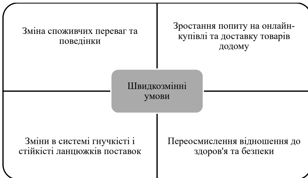
Рис.2. Ключові зміни в діяльності підприємств торгівлі внаслідок умов зумовлених пандемією COVID-19