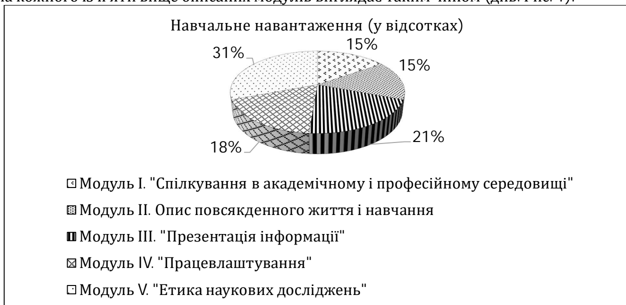
Рис. 1. Розподіл аудиторного часу по модулях на вивчення іноземної мови за професійним спрямуванням

Аналіз розподілу аудиторного часу на вивчення дисципліни загалом (195 годин) і на кожного із п'яти вище описаних модулів виглядає таким чином (див. Рис. 1):