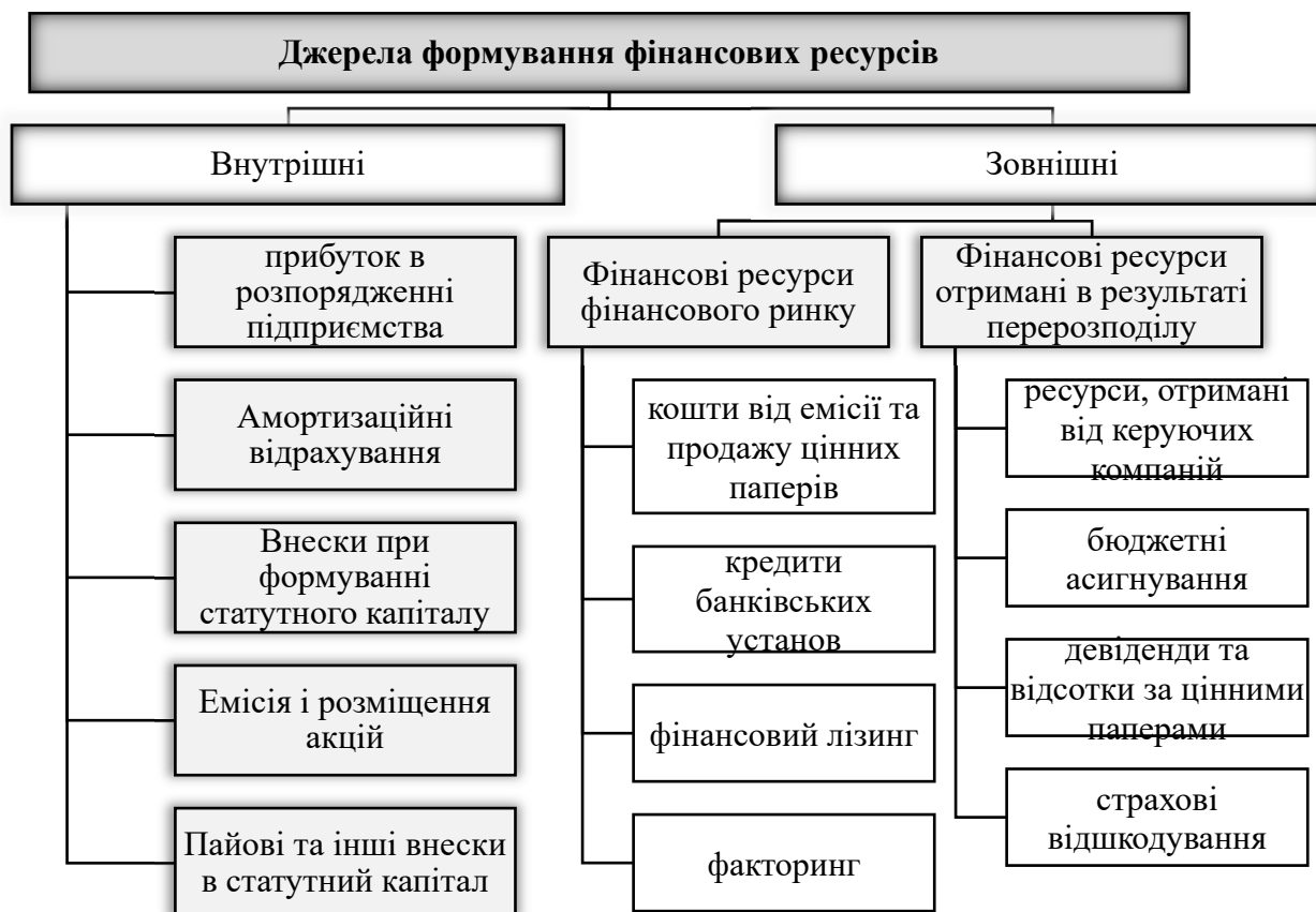
Рис. 2. Джерела формування фінансових ресурсів підприємства