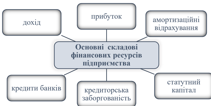
Рис. 1. Основні складові фінансових ресурсів підприємства